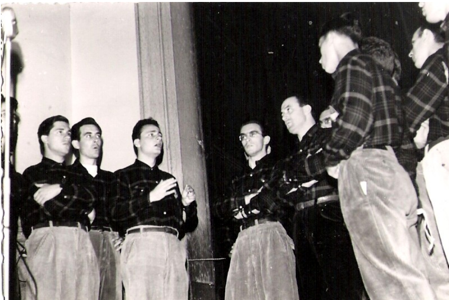
14 agosto 1955 - Pronao della Chiesa Parrocchiale di Domegge (BL).

Concerto di Natale organizzato dalla Ass.Naz.Alpini